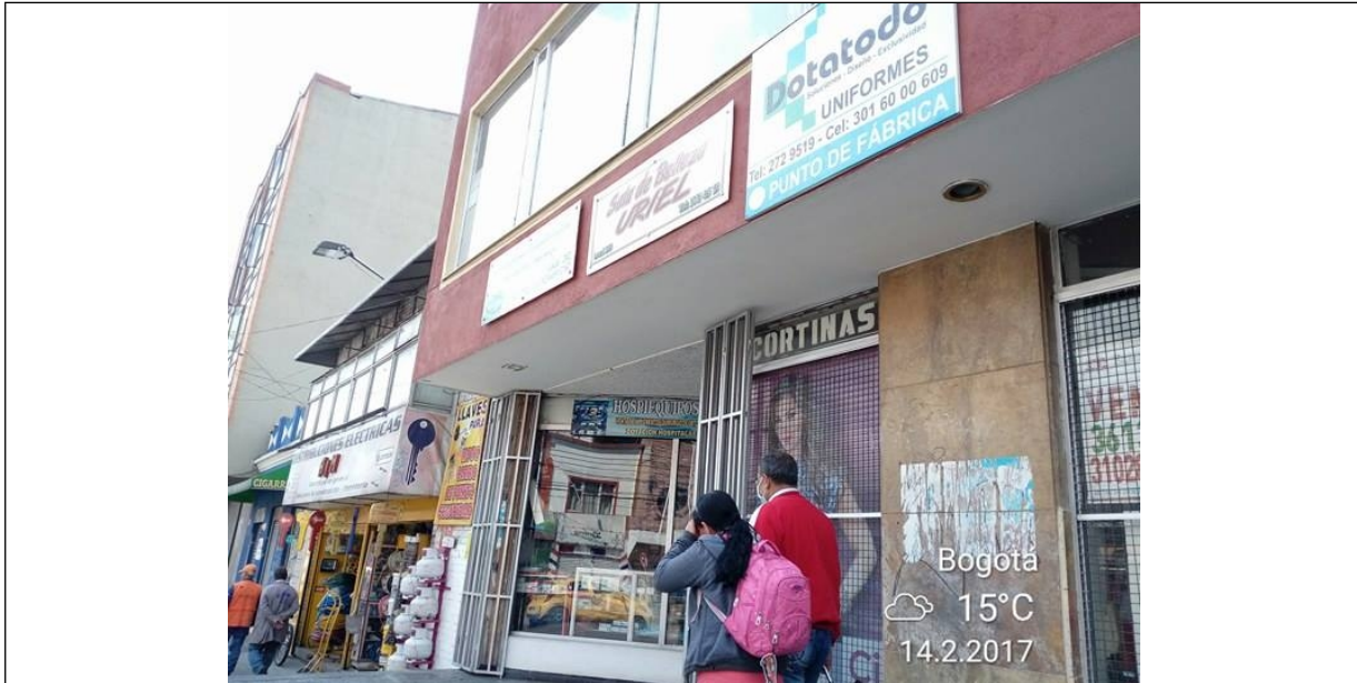
Fotografía No. 2: Panorámica del Aviso del establecimiento DOTACIONES CONFECCIONES MEDICAS, ubicado en la Calle 15 Sur No. 17 – 44 Local 102, elemento tipo aviso en fachada